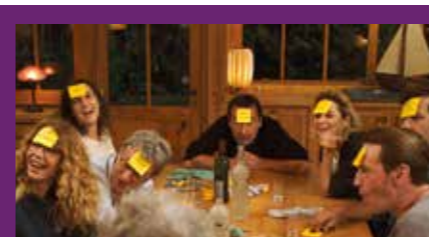
NOUS FINIRONS ENSEMBLE