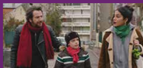
LA LUTTE DES CLASSES